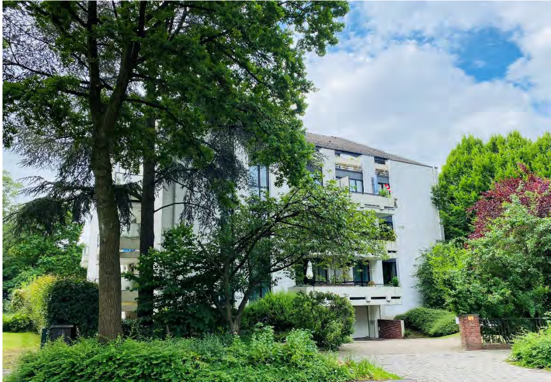
AUSSENANSICHT MIT EINFAHRT GARAGE

PENTHOUSE-EIGENTUMSWOHNUNG in BREMEN-SCHWACHHAUSEN